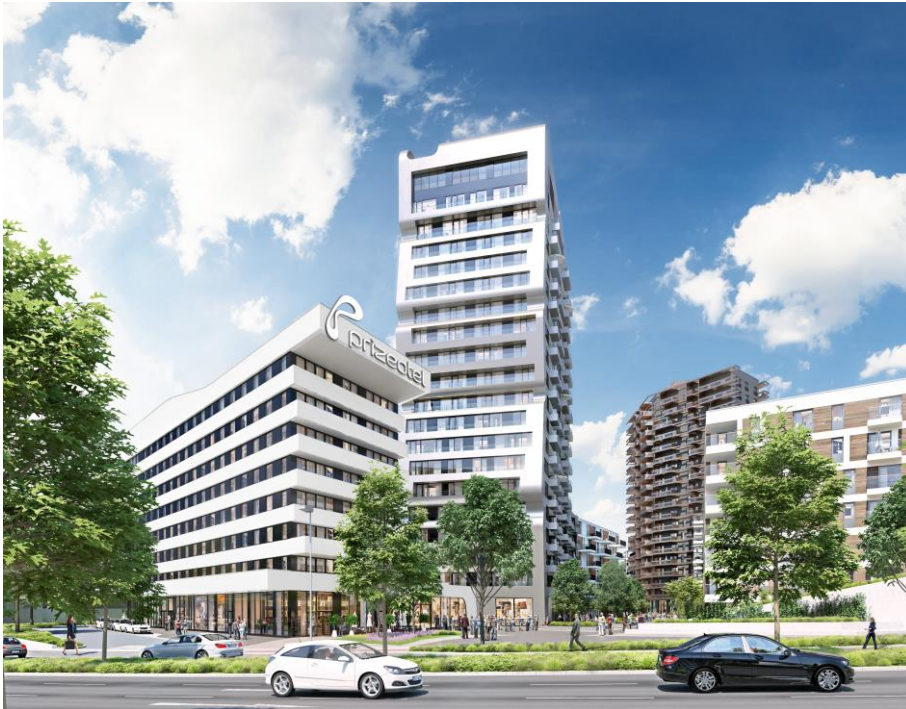
Grand Central Düsseldorf

Die Catella Group zählt zu den führenden Unternehmen in den europäischen Immobilienmärkten. Unsere Stärke liegt im Bereich der immobilienbezogenen Corporate Finance. Catella in Deutschland ist bundesweit aktiv und spezialisiert auf die Betreuung von Immobilieninvestitionen und Portfolio-Beratung sowie auf die Bereiche Projektentwicklungsmanagement und Vermietung. Die Breite unseres Leistungsspektrums ermöglicht es uns, alle Phasen eines Immobilienengagements erfolgreich zu begleiten.