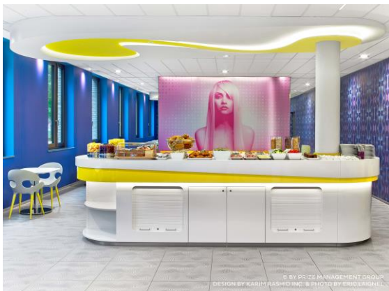
Innenansichten vom prizeotel in Hannover

Der Star-Designer Karim Rashid übernimmt die Gestaltung des Hotels bis ins Detail. Die besondere Architektur kommt vom Star-Architekten Jürgen Mayer H. – zwei weltweite anerkannte Künstler schaffen gemeinsam für die Landeshauptstadt Düsseldorf eine attraktives Aushängeschild am Eingang zum Grand Central und an der Schnittstelle von Hauptbahnhof und Kulturmeile wie Capitol-Theater und Tanzhaus NRW.