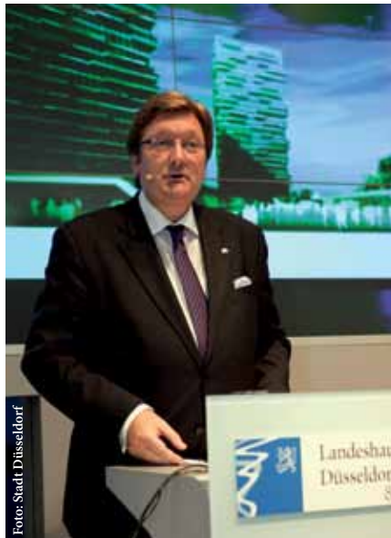
OB Dirk Elbers wird auch in diesem Jahr wieder die wichtigsten Projekte am Stand präsentieren.

Pünktlich zur Messe fertiggestellt wird auch der Immobilienbericht der Wirtschaftsförderung, der diesmal aus verschiedenen Faktenblättern besteht. Aktuelle Daten und Zahlen zum Büro-, Gewerbe- und Hotelflächenmarkt werden vorgestellt. Neu ist eine große Karte mit den aktuellen Bürobauprojekten und Bürobauflächen, in der auch jene Flächen eingezeichnet sind, auf der Entwickler künftig Bürobauprojekte realisieren können. Auch der jährlich erscheinende Gewerbemietpiegel ist weiter als Faltpapier erhältlich. Aus ihm gehen, nach Stadtgebieten sortiert, Mietzinsspannen für Ladenlokale, Büroflächen sowie Lager- und Produktionsflächen hervor, aber auch die Bodenrichtwerte.