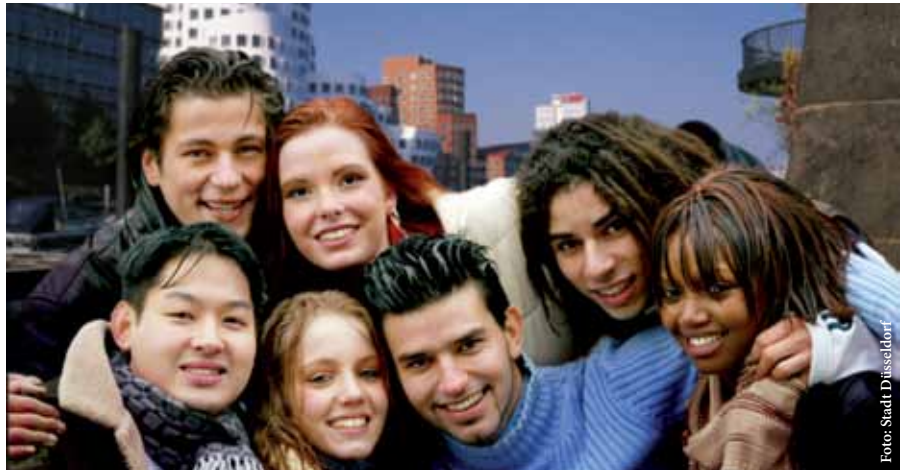
Die internationale Metropole Düsseldorf steht im Wettbewerb mit anderen Städten um qualifizierte ausländische Neubürger und Neubürgerinnen.

Zu den Vorschlägen des Handlungsplans gehört unter anderem die Einrichtung eines „Düsseldorf Welcome Centers“ als zentrale Anlaufstelle für internationale Bürgerinnen und Bürger. Dort soll über die Angebote an Dienstleistungen in der Stadt zu Wohnen und Infrastruktur/Verkehr, Bildungseinrichtungen und